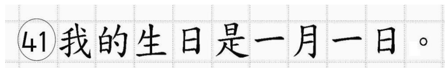
Рис.16. Образец написания иероглифических знаков

Записи в лист 1 и лист 2 бланка ответов № 2 делаются в следующей последовательности: сначала заполняется лист 1, затем заполняется лист 2. Записи делаются строго на лицевой стороне, оборотная сторона листов бланка ответов № 2 по китайскому языку НЕ ЗАПОЛНЯЕТСЯ!!!